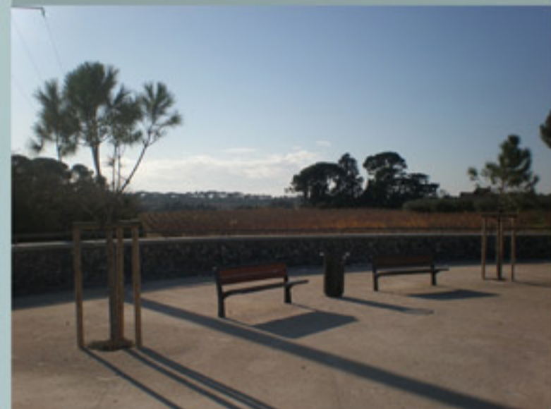
belvédère avec vue sur la campagne