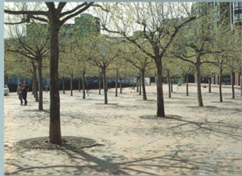
placette avec maillage d'arbres