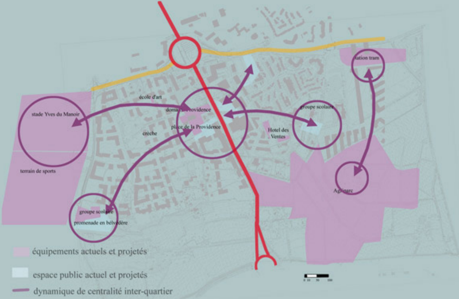
maillage étroit et complémentaire entre équipements et espaces publics