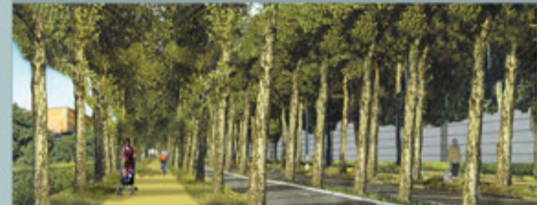
avenue avec alignements d'arbres et circulations douces