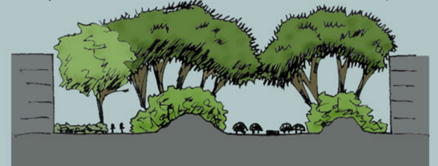
coupe avenue Pavelet