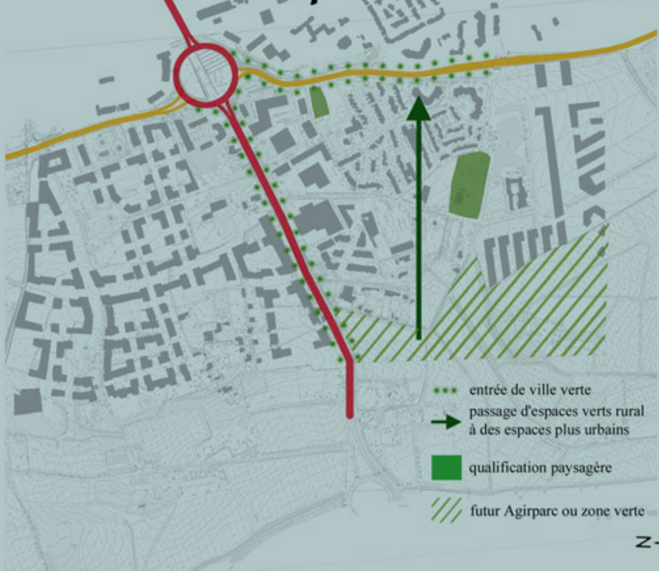
entree de ville verte