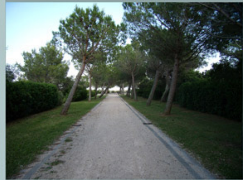
cheminements piétons et cycles

Enjeux: -traiter les entrées de ville -mettre en valeur le territoire -intégrer le quartier entre les deux nouveaux quartiers et l'agriparc -améliorer la qualité de vie des habitants