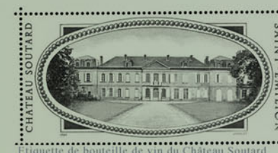
Etiquette de bouteille de vin du Château Soutard

Ces trois lieux ont pour points communs d'être rattachés à une architecture en pierre, d'un arbre ou arbuste au port remarquable offrant une zone d'ombre appréciable et de la présence d'eau.