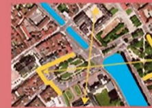
Le lieu est un territoire