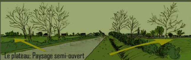
Le plateau: Paysage semi-ouvert