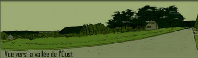
Vue vers la vallée de l'Oust

Agence de paysage LEBER - Réalisation d'un plan de développement urbain et aménagement d'espaces publics du centre-bourg - Virginie LEGOUPI - infographie paysagère 2007/2008