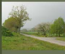
4 L'île aux Pies