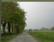
2 La Vallée de L'Oust