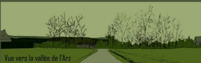
Vue vers la vallée de l'Arz