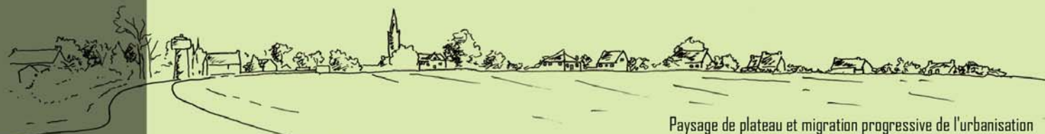
Paysage de plateau et migration progressive de l'urbanisation