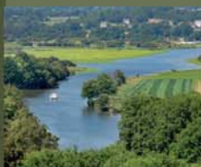
3 La Vallée de l'Arz