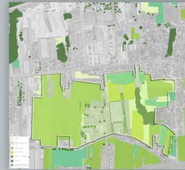
Un milieu ligérien à fort potentiel écologique