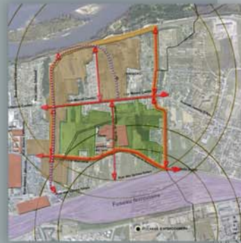
Protection réglementaire pour le site