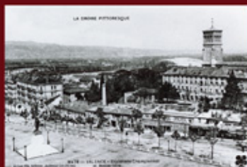
L'esplanade de la place Championnet et l'avenue Gambetta - 1910