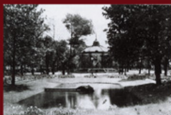
Champ de Mars - 1911