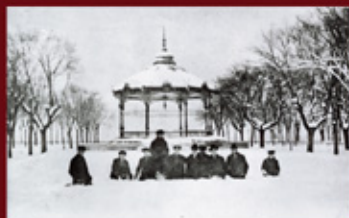
Le Champ de Mars sous la neige - 1917

Mais très vite, malgré son utilité et sa fréquentation, elle devient une zone de stationnement. Le kiosque est aujourd'hui classé au monuments historiques.