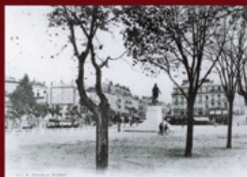
Place du Champ de Mars : 1910