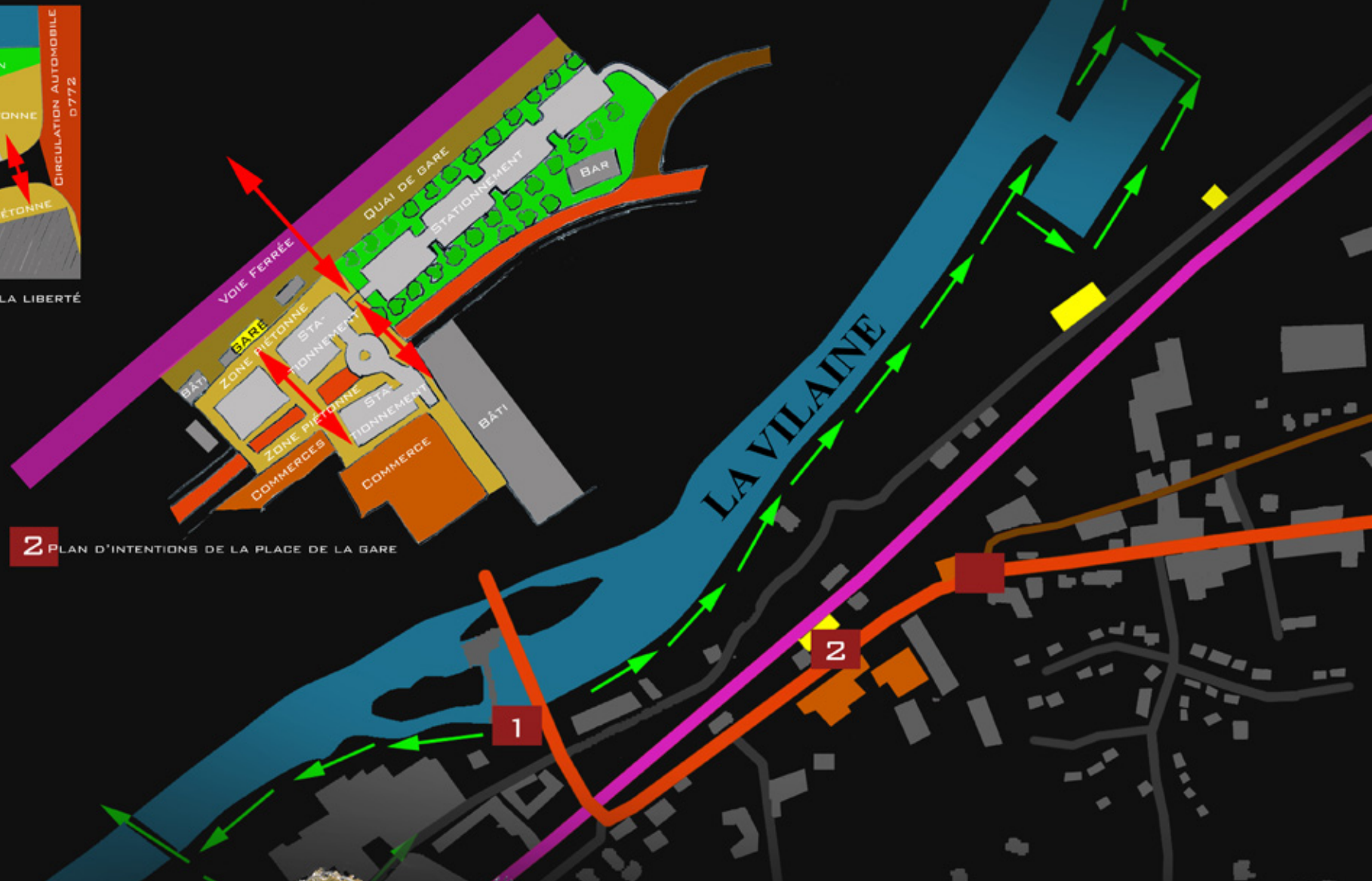
2 PLAN D'INTENTIONS DE LA PLACE DE LA GARE