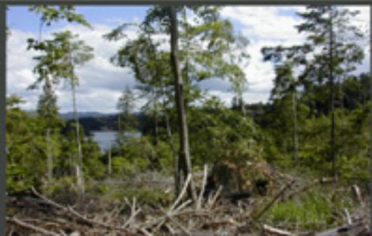
Des dégâts de tempête importants.