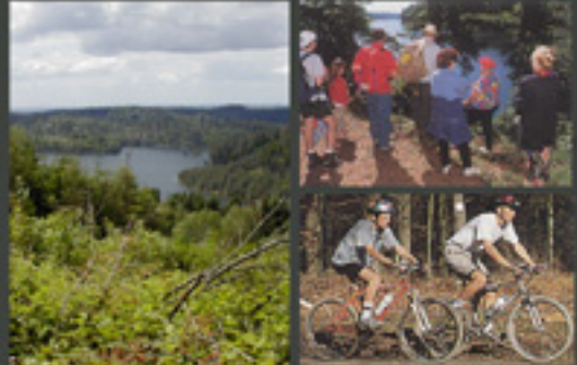
Une forêt tournée autour de son lac, avec un fort potentiel touristique régional voire national (randonnées, activités nautiques, vtt...)