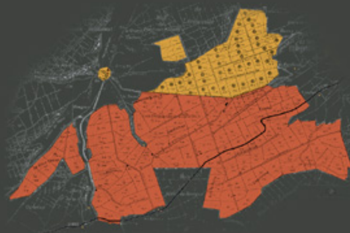
2300 ha de forêt communale et domaniale