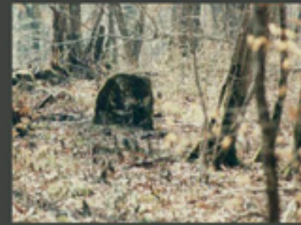
« PATRIMOINE NATUREL ET HISTORIQUE »

Comment accueillir de multiples usagers?