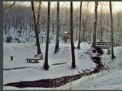
« SPORT ET DE LOISIRS »

Une demande des usagers d'une forêt dite naturelle, tout en lui reconnaissant une fonction de production