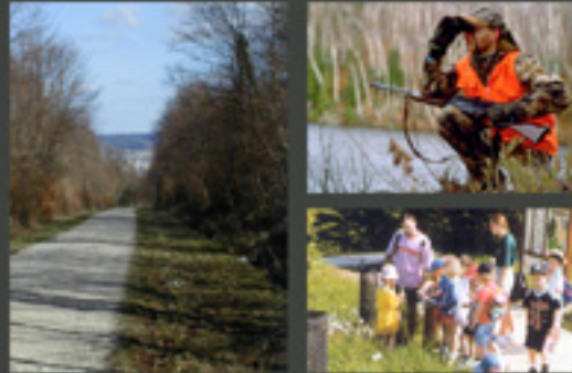
Une forêt périurbaine avec des fonctions parfois contradictoires de production, d'accueil, de chasse...