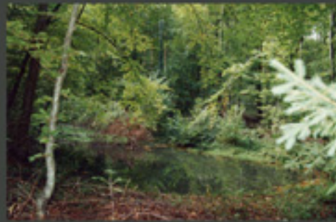
« ENTRE NATURE ET PRODUCTION »

Une demande des usagers d'une forêt dite naturelle, tout en lui reconnaissant une fonction de production