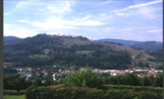
Une sensibilité paysagère forte : le versant se situe juste au dessus du village