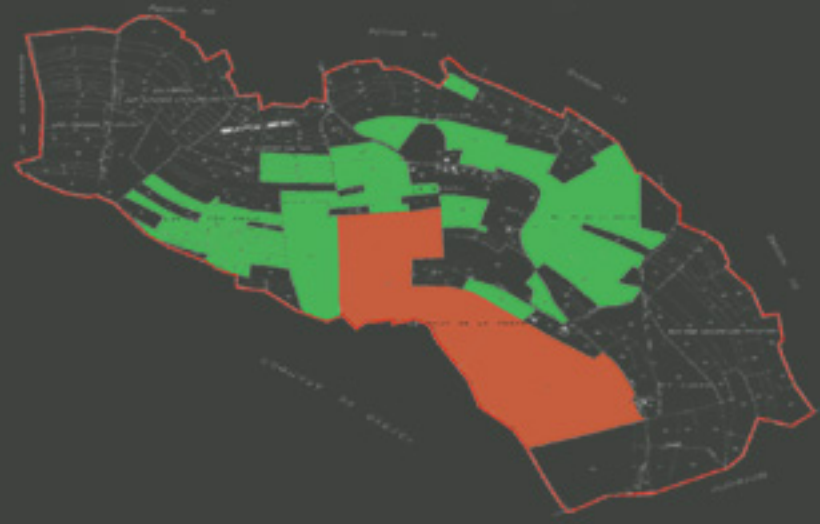
30 ha de forêt dont la moitié appartient à la commune et l'autre est privée (une vingtaine de propriétaires)