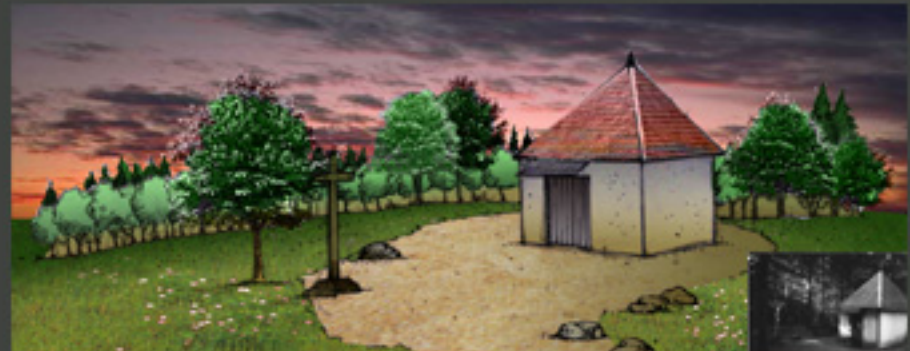
Maintenir des zones ouvertes ...