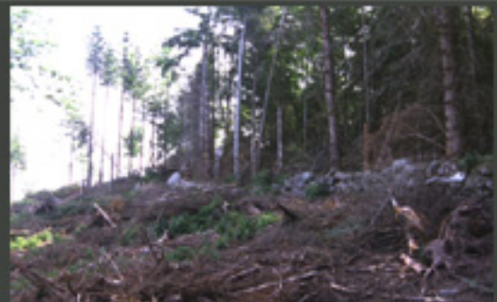
Un versant fortement touché par la tempête