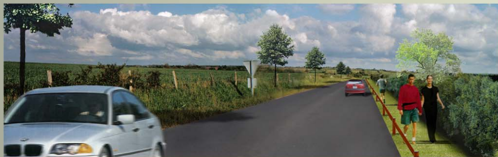
Passage piéton agréable et sécurisé

Intégration réussie des équipements en utilisant des matériaux naturels comme le bois.