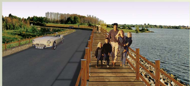
Circulation des piétons sur une passerelle en bois.