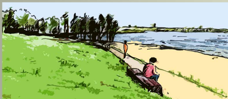
Une aire de repos pour apprécier la vue sur le lac.

Un site entièrement sécurisé et protégé.