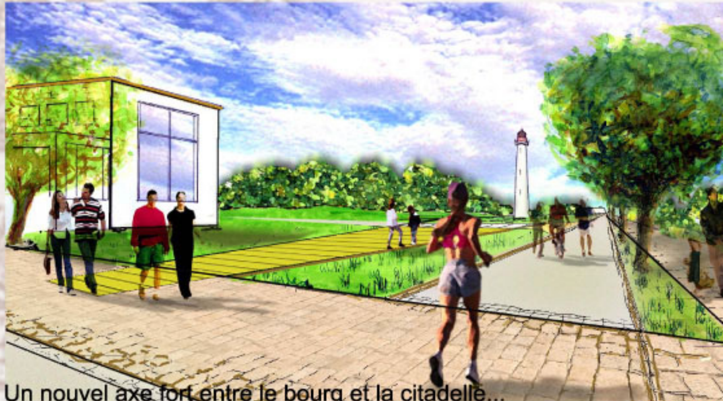
Un nouvel axe fort entre le bourg et la citadelle...