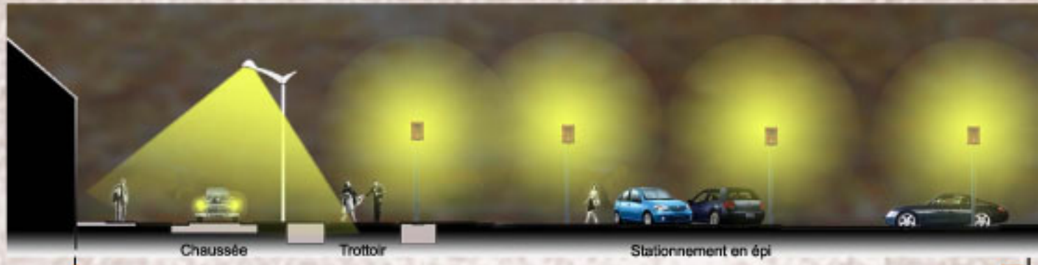
A Coupe transversale de la place de la république... B