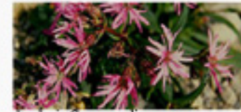
Lychnis flos-cuculi fleur de coucou