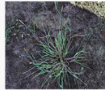
Alopecurus geniculatus vulpin