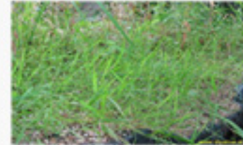
Agrostis stolonifera agrostide