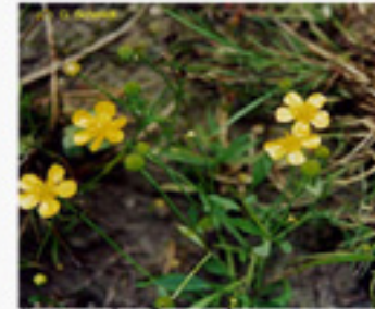
Ranunculus flammula renoncule