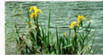
Iris pseudocorus iris d'eau