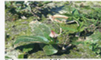
Polygonum amphibium renouée amphibie